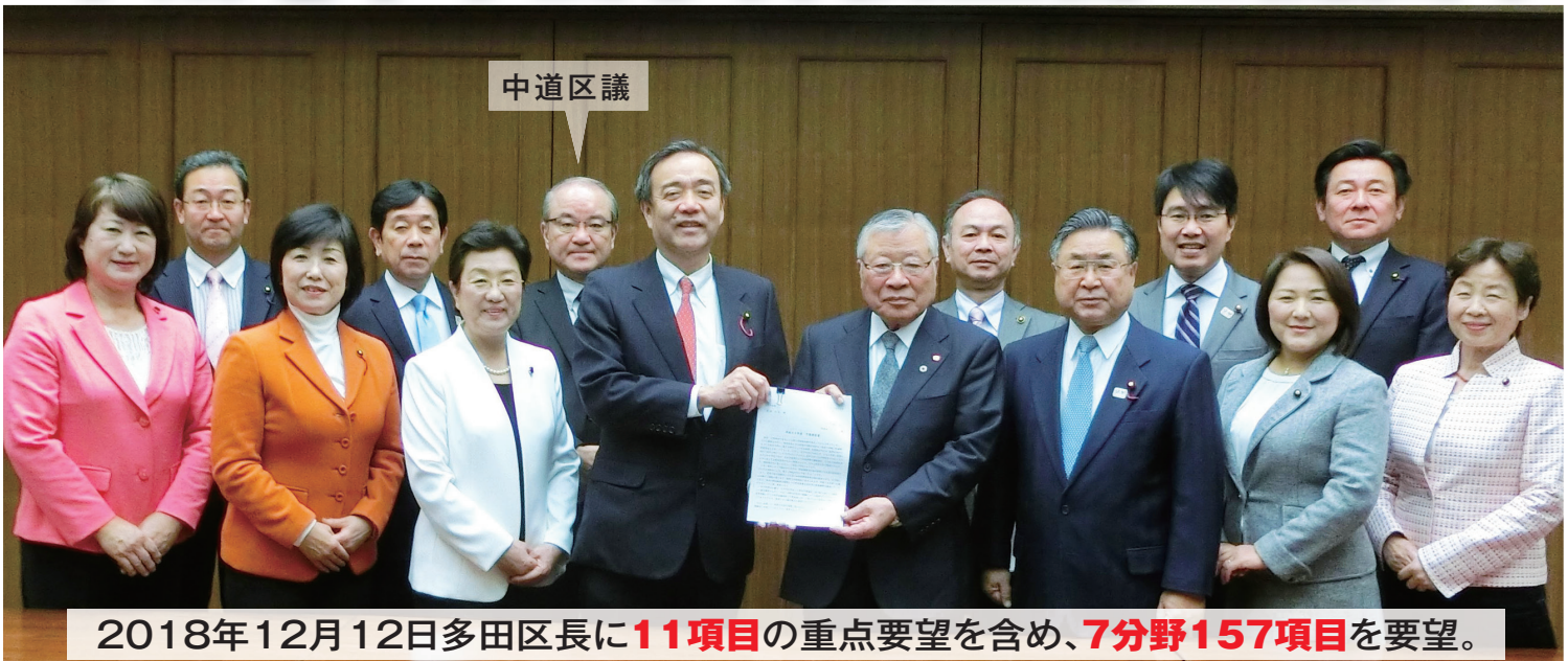
2018年12月12日多田区長に 11項目 の重点要望を含め、 7分野157項目 を要望。